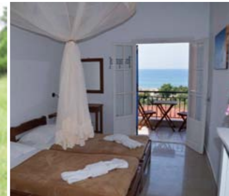
Kleine Gästeanlage mit 13 Wohneinheiten