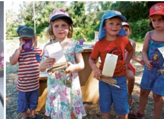
Stolz werden die eigenen Bauwerke präsentiert