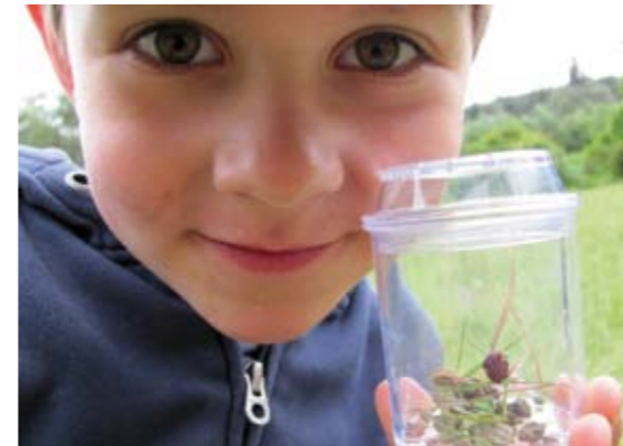
Spannendes und kreatives Kinderprogramm